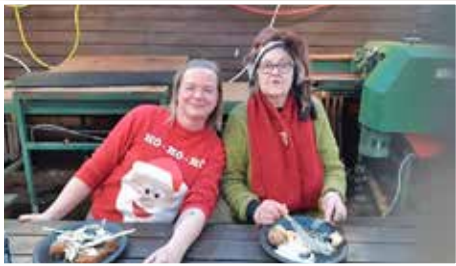
Skötuveisla í gróðurhúsi.