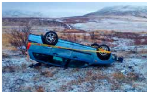
Oltinn á Ásunum.

Ásarnir taka sinn toll. Einkennilegur bretavegur yfir hæð, sem er óþarfi. Áður var farið með fram Köldukvísl. Deiliskipulag vegar í gegnum Mosfellsdal ætti ná frá Vesturlandsvegi að Grænuþorg. Allt annað er hjóm og bútasamur. Eins má nefna svokallað bæjarhlið, sem átti að minna ökumenn á að byggð væri fram undan. Eitt hlið er komið undir Úlfarsfelli, sem af einhverjum ástæðum lítur út eins og kamar.