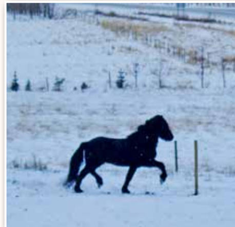
Einmana gæðingur á Horninu.