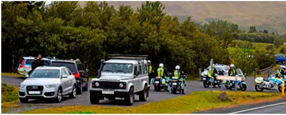
Norrænir forsætisráðherrar fá kaffisopa í Glfúfrasteini. Löggurnar fengu ekkert.