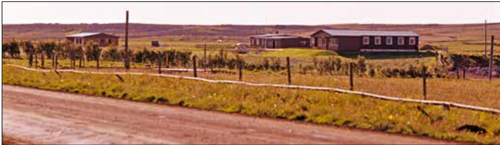
Árið 2004 var heimilið leyst upp og strákunum komið fyrir í sérbýlum.