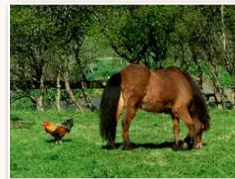
Tveir kunningjar á beit.