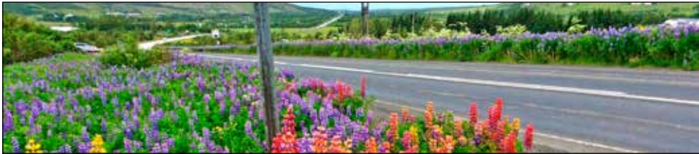
Það má hressa upp á lúpínurnar með ýmsu móti.

- Svæði Skógræktarfélags Mosfellsbæjar í Mosfellsdal