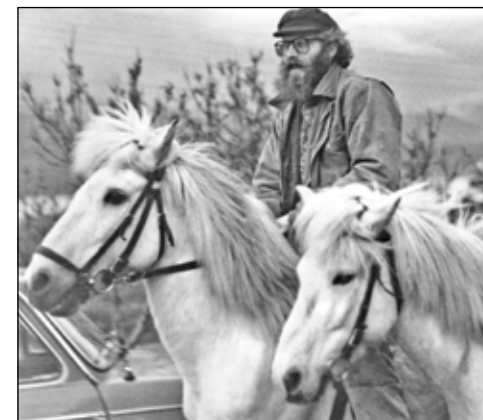
Fróði í Dalsgarði, sem hefðu orðið 75 ára, að hefja gandreið. Guð geymi hann.