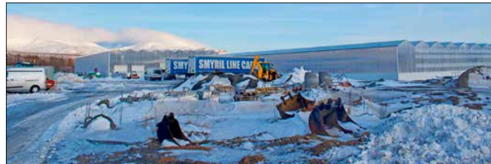
Þessum merku framkvæmdum er lokið. Það er aðeins þriðjungur kominn.

Engum í dalnum dylst gróðrarstöðin sem verið er að reisa á Lundi. Það er Hafberg í Lambhaga sem er að byggja stærstu gróðrarstöð landsins. 7000 fm. eru þegar komnir, en alls verður stöðin 22.000 fm. að stærð. Þegar ræktunin er komin í gang, kemur ekki mannleg hönd þar nærri, allt sjálfvirk og stjórnað með flóknnum vélbúnaði. Hafberg mun einungis rækta salat í stöðinni, úr eðalfræjum