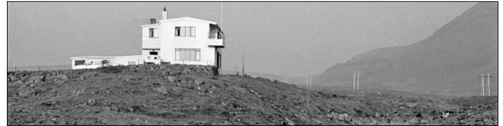
Gljúfrasteinn án trjáa. ca. 1948