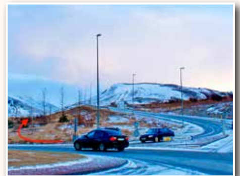
Hvers vegna að aka upp Ásana, frekar en á jafnslettun?