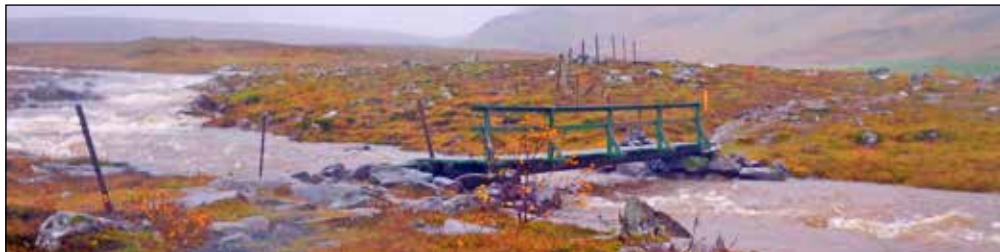
Göngubrúin yfir Jónsselslæk. Rennslíð jókst um nóttina og náði upp í brúargólfíð.

Göngubrúin yfir Jónsselslæk á göngu-leiðinni að Helgufossi, fór á flot einn góðan veðurdag í miklum vatnavöxtum. Hún hvarf alfarið og var farið að leita. Vikum síðar fannst hún fyrir neðan Golf-skálann. Handriðslaus, en brúkonarhæf. Var nú brúin sett upp aftur með nýju handriði, sem sett var á, en öfugt. Brúin er því stórhættuleg og bæjaryfirvöld beðin um að snúa handriðinu við. Það hefur vafist fyrir þeim í nær tvö ár og varla verður neitt aðhafst fyrr en einhver dettur milli handriðs og brúar. Þá kannski vaknar einhver? Þetta er auglýst gönguleið og það er varla að dagur líði að hópur sé ekki að ganga upp að Helgufossi.