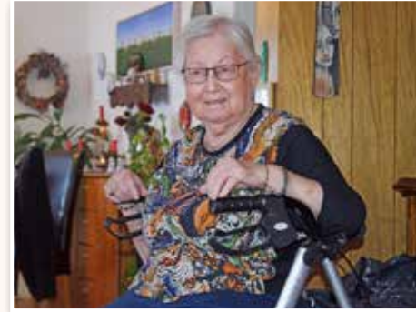
Disa í Helgadal hugsí. Enda stendur mikjið til.