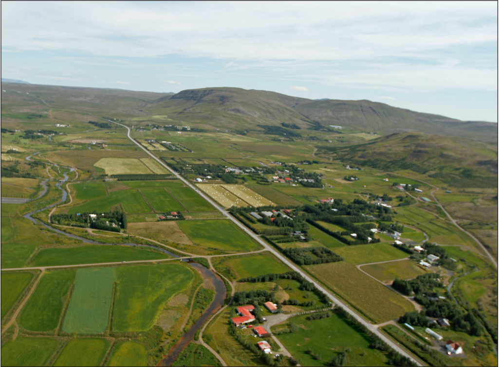
Horft yfir Mosfellsdal.