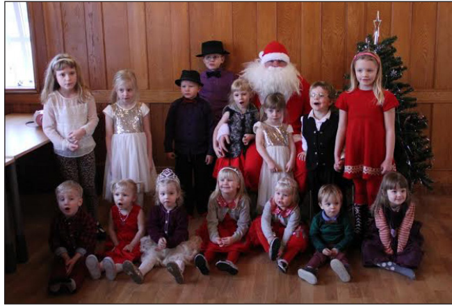
Frá jólaballinu í Reykjadal.

Dalalæðurnar hafa haldið uppteknum hætti í dalnum nú sem endranær. Markmið þeirra þetta árið hefur aðallega verið tengt börnum dalsins; að stuðla að frekari samskiptum milli þeirra og þar með fjölskyldnanna.