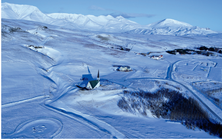
Þann 4. apríl nk. verða 50 ár liðin frá vígslu Mosfellskirkju. Guðni Þor- björnsson tók myndina 30. janúar 2015.

Í brakberri á háum hól himins frægu túna brosir mæt við morgunsól Mosfellskirkja núna.