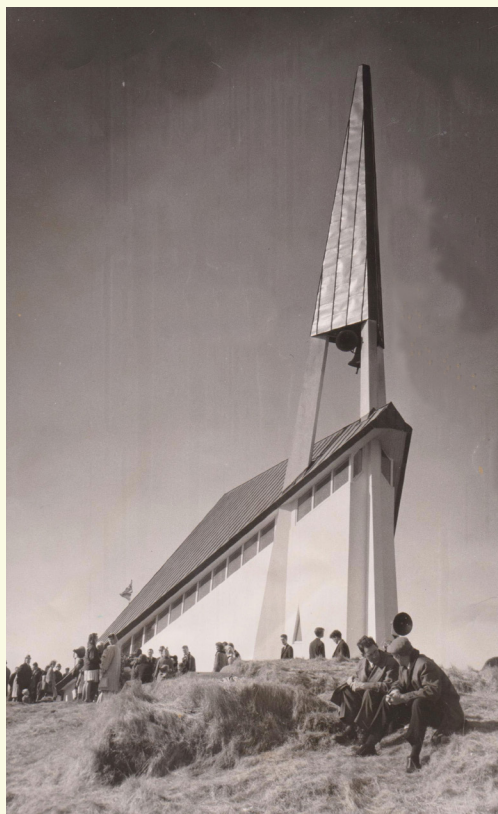
Frá vígsludegi Mosfellskirkju 4. apríl 1965. Mikill mannfjöldi kom á staðinn svo ekki rúm- uðust allir í guðshúsinu nýja. Hátölurum hafði verið komið fyrir utandyra svo þar var hægt að fylgjast með því sem fram fór í kirkjunni.

Við veljum að kalla það leshóp á léttum nótum. Allt áhugafólk um bókina er velkomið, dagskráin verður sem hér segir: