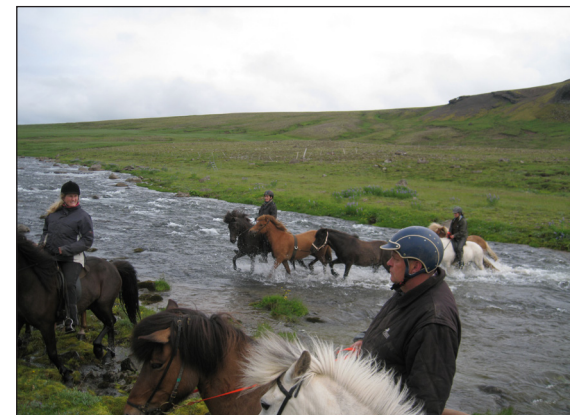
Riðið yfir Leirvogsá.

Að þessu loknu var fornleifauppgröfturinn á Hrísbú kannaður, síðan var sest í hnakk og haldið út með Mosfelli. Framinn var örnefnagjörningur vestan við fjallið þar sem lögð var reiðgata á sínum tíma fyrir hestaleiguna og var hún merkt með nýju örnefni: Ólafsgata .