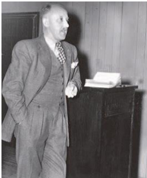
Halldór Laxness las úr Atómstöðinni á 40 ára afmæli Aftureldingar árið 1949. Myndin er tekin í Brúarlandi.

Um fellin voru reistar umfangsmiklar víggríðingar úr gaddavír og meðfram þeim lágu ótal símalínur frá varðbyrgjunum niður í stjórnstöðvar hersins, enda var herliðið viðbúið hinu versta ef skyndiárás þýska hersins yrði að veruleika. Síðar kom í ljós að Þjóðverjar höfðu gert áætlun um hernám Íslands og gekk hún undir nafninu Ikarus. Bretar óttuðust að Þjóðverjar sendu hingað án nokkurs fyrirvara fjölmennar sveitir fallhlífarhermanna sem gætu valdið miklu uppnámi og tímabundinni upplausn.