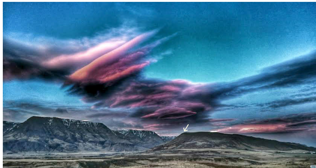
Horft í áttina að Esju og Mosfelli. Örin bendir á staðinn þar sem enn má finna leifar af varðbyrgi frá hernámsárunum.

Mosfellingum leist vel á þessa hugmynd, Sigurjón gekk í málið en vegna mistaka eða fyrir einhverja handvömm urðu núllin í