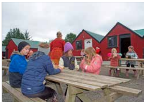
Fjör í kringum fóninn í húsdýrgarðinum á Hradastöðum