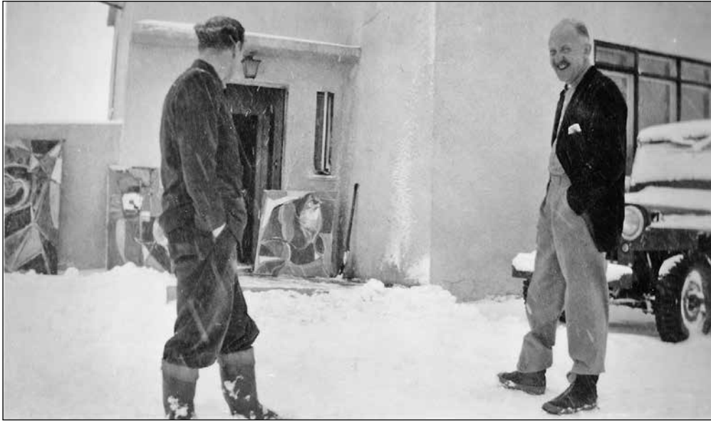
Halldór Laxness og Svavar Guðnason.