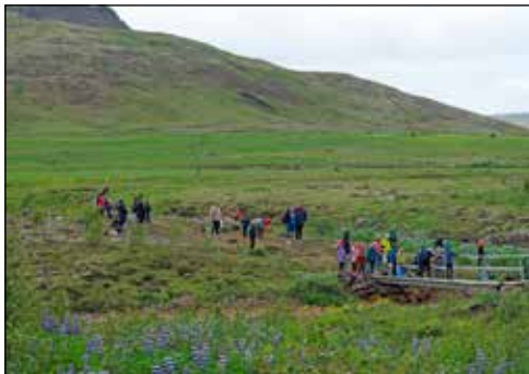
Pilgrímsferð ungmenna að Helgufossi.