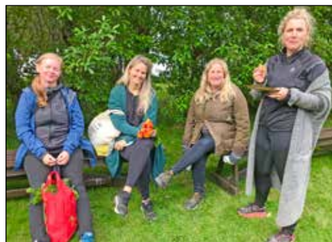
Halla Fróða trufluð við ræðuhald