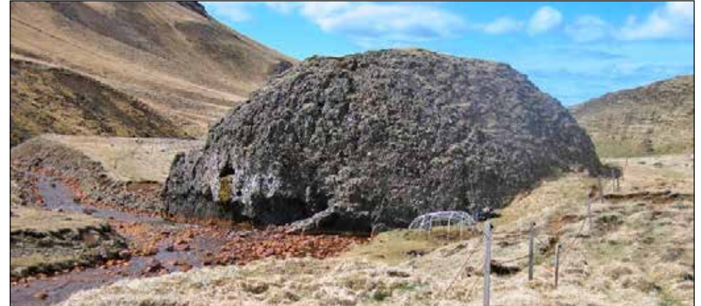
Helguhóll.

Fyrsta förukona Íslands, Helga Bárðardóttir í fornsögunni Bárðar sögu Snæfellsáss hóf að flakka í kjölfar ástarsorgar. Förukona sem var í senn tröllkona og mennsk kona. Í sögu Helgu segir frá henni sem ungri stúlku, sem með lævislegum karla-brögðum er hrakin úr íslensku feðraveldi út á jadarinn; Eystribygð á Grænlandi. Á útmörkum alheimsins, í Bröttuhlíð í Eiríksfirði á Grænlandi, fellur Helga dalbúi hug til manns, sem síðan svíkur hana í ástum;