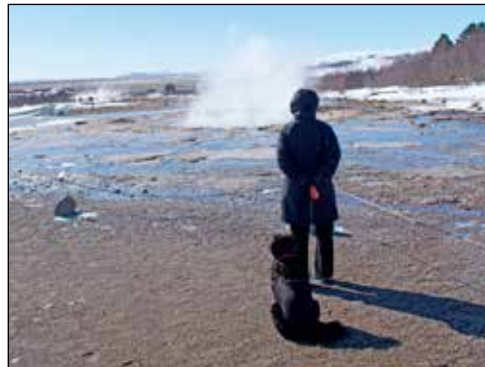
Geysissvæðið veturinn 2021

Í kvikmyndinni um Snorra Sturluson 1979 var Reykholtslaug endurgerð í Helgadal af því það var svo auðvelt.