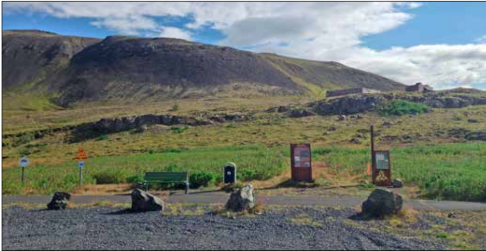
Ásar „Vel skipulagður áningastaður fyrir ferðamenn“

Ekki hefur sést til hauslausu hjúkkunar sem var á sveimi á Ásunum eftir seinna stríð og þáði far með ýmsum einmanna körlum. Skýring á því hefur ekki fundist, en af rælni rakst einhver á gamlan mogga: Í Morgunblaðinu 8.september 1991 segir: Reimt er í Sléttalandi við Suðurlandsveg. Hús þetta var byggt sem félagsheimili um 1950. Húsið var klætt innan með mason-