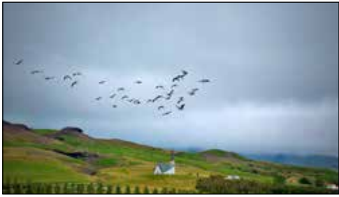
Gæsir eru orðnar staðfuglar í dalnum

Uppsetning öryggismyndavéla er í farvegi og skv. tímaáætlun í svari frá Mosfellsbæ ætti sú framkvæmd að hefjast eftir þetta ár eða 2023. Einnig er mikill vilji hjá bæj- aryfirvöldum að halda hektara lóðum óbreyttum og fögnum við því.