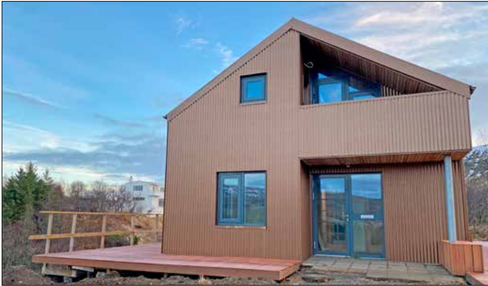
Jónstótt verður móttökuhús safnsins.

Dalbúar hafa væntanlega tekið eftir framkvæmdum við Jónstótt við Gljúfrastein. Árið 2019 festi ríkið kaup á eigninni Jónstótt undir starfsemi Gljúfrasteins. Gert er ráð fyrir vinnuáðstöðu fyrir starfsfólk á efri hæð hússins en móttaka og safnbúð fyrir gesti á neðri hæðinni.