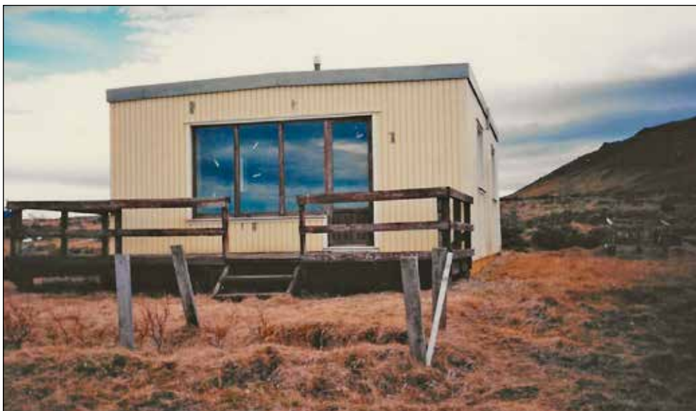
Búnkerinn, skjallasafnið á Hraðastaðavegi, eftir að búíð var að stækka glugga, setja pall og klæða.