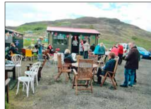
Sunnudagskaffi / sumarveisla í Kartöflusetrinu.

Skammælingar hafa verið duglegir við að laga kofana sem hafa gengið í endurnýjun lífdaga og á endalausum sólskinsdögum má heyra hamarshögginn glymja í dalnum. Kartöflusetrið er félagsmiðstöðin okkar með sunnudagskaffi nokkrum sinnum yfir sumartímann og kósí kvöldvöku í koldimmunni á haustin. Undanfarin tvö