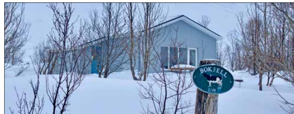
Skjallasafnið er nær óþekktanlegt í dag og er enn rammgerð bygging

Er þau boðin velkomin í dalinn og sagan heldur áfram. - G.H.