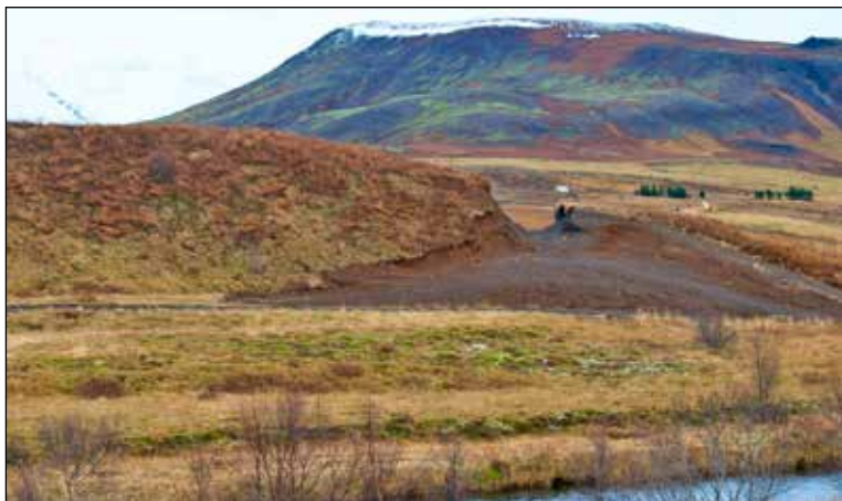
Hestamenn sýna náttúrunni virðingarleysi með gröfuskaki