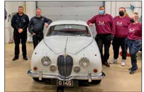
Jagúar Halldórs Laxness

Einn af safngripunum á Gljúfrasteini er Jagúar árgerð 1968. Bíllinn stendur venjulega í hlaðinu yfir sumarmánuðina en á veturna er hann hafður inni. Í október á síðasta ári var undirritaður samstarfssamningur Gljúfrasteins við Borgarholtsskóla um viðgerð á bílnum. Verkefnið verður unnið af nemendum skólans undir styrkri handleiðslu fagkennara. Unnið er að því að slípa lakkið, ryðbæta og sprauta. Þá verður skipt um gúmmí, læsingar lagðar og ýmislegt annað smálegt. Gert er ráð fyrir að verkefninu ljúki næsta vor og að Jagúarnum verði ekið í hlað á afmælis-