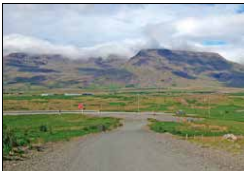
Séð til norðurs yfir svæðið þar sem hersítalinn stóð.

Fjölmargir hafa séð hjúkrunarkonunni bregða fyrir á Sléttalandi og lýsa henni eins og þeir sem tóku hana upp í á Ásunum. Vafalaust er þetta sama vofan og ráðgáta hvers vegna hún fylgdi masonítinu. Spurning er hvort það sé hægt að fá hana aftur upp á Ása?