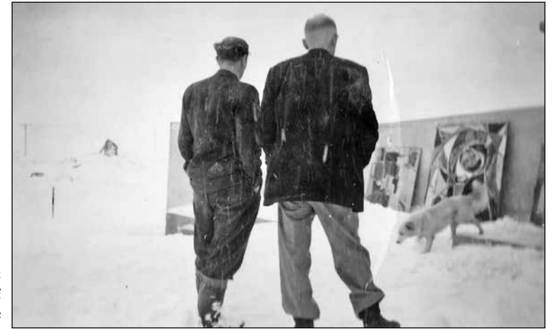
Halldór Laxness, Svavar Guðnason og Snati