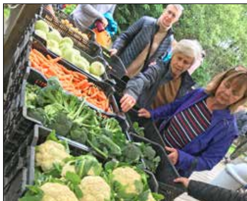
Spriklandi fínt kál