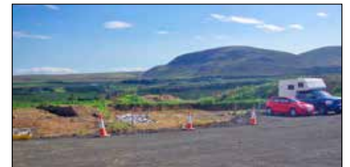
Bílastæði ofan á rústum og beinum á Mosfelli

Er á meðan er. Fólk kemst til Þingvalla og jafnvel enn lengra eftir að Gjábakkavegur var bættur á þotuhraða.