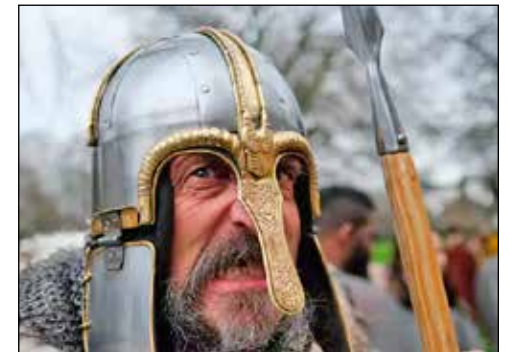
Ólafur var féggjarn og hégómlegur, en ólæs.