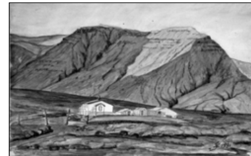
Lagðsnes - Laxness. Málverk - Teiknað 1931

ekki var um villst að skógur þakti dalinn langt upp að heiðarbrún. Rúið fé hefur verið rekið upp fyrir Skógarbringurnar, upp á háheiði og þegar hausta tók til baka sömu leið.