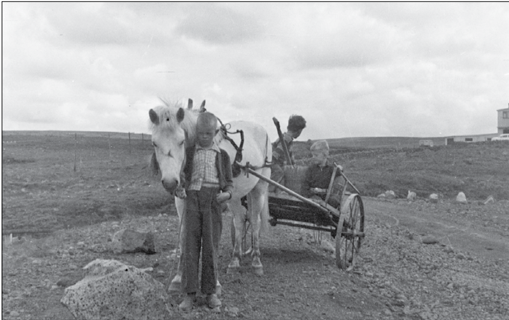
Strákar á hestvagni fyrir neðan Gljúfrastein kannski 1952. Hverjir eru þeir?