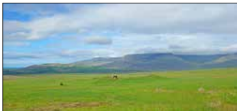
Betri er einn með yndi en tveir með trega

Í einni ágætri skáldsögu Dickens er sagt að tímarir hafi verið í senn góðir og slæmir. Vindar, eldgos og vírusar hafa frá örófi alda feykt pestum og harðindum yfir landið okkar, en inn á milli hafa komið bjartar stillur. Mosfellsdalurinn er að verða skógi vaxinn og skjól hefur myndast fyrir miskunarlausum blæstri. Það er langt um liðið síðan bílar hafa tekist á loft eftir þorralót og skólabíllinn hefur ekki lent ofan í skurði í háa herrans tíð.