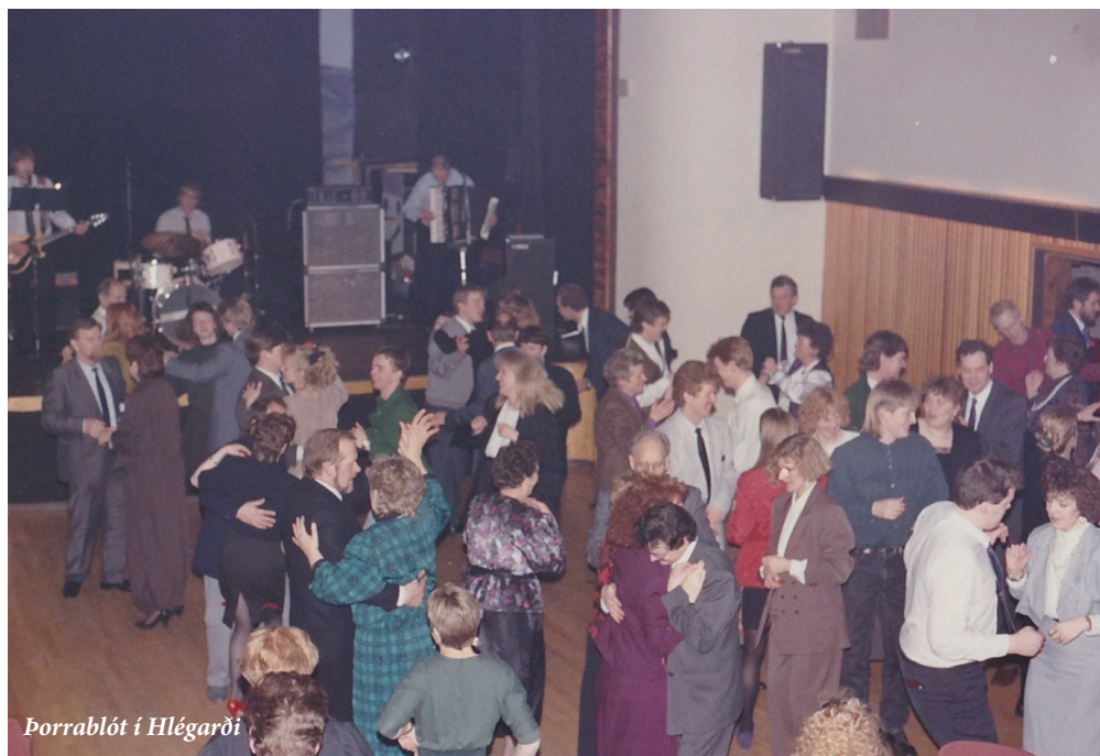
Borralót í Hlégarði