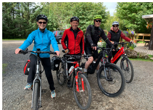
Dagarnir nýttir til útivistar