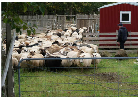
Féið rekið af fjalli og inn í rétt