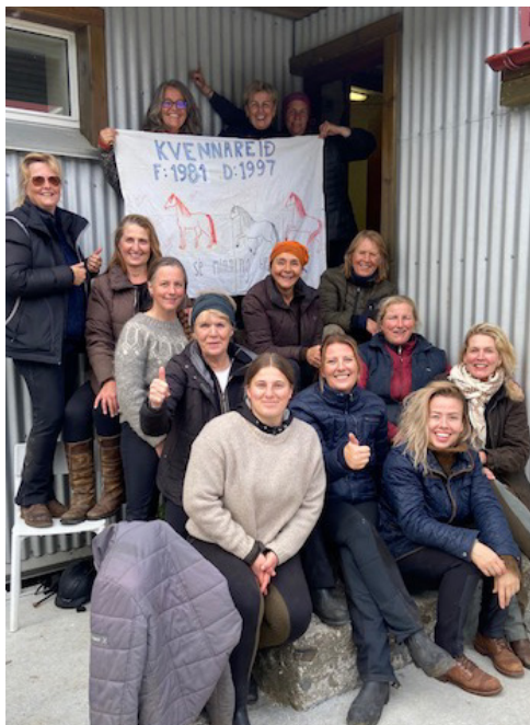
Signý á Furuvöllum straujaði gamla kvennareidarfánann

Flamberuðu kleinurnar fóru í kvennareid á árinu. Hnarreistar lögðu þær af stað frá Ástu Dóru í Reykjahlíð á svoleiðis gæðingum að annað eins hafði ekki sést í háa herrans tíð.