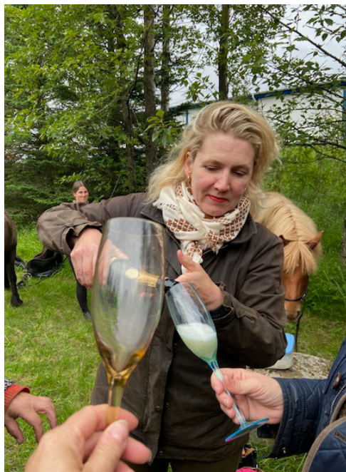
Freyðandi og Flamberað