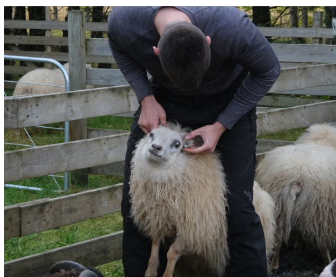
Er betra að vera hávaxinn?