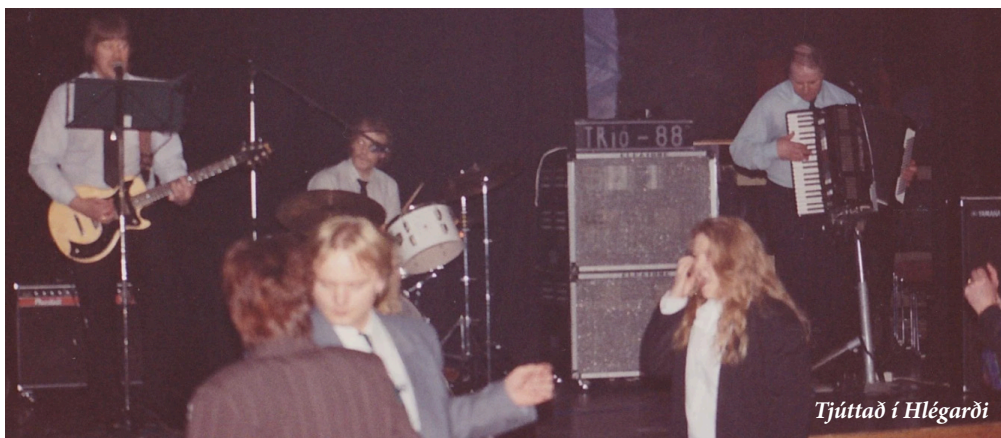
Tjúttað í Hlégarði