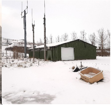
Sami staður 2023