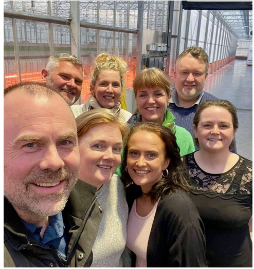
Stjórn Víghóls og vaskir frambjóðendur

Stjórn Víghóls þakkar frambjóðendum fyrir hittinginn fyrir kosningar og sýndan áhuga á málefnum Dalbúa. Það var fámennnt en góðmennt.